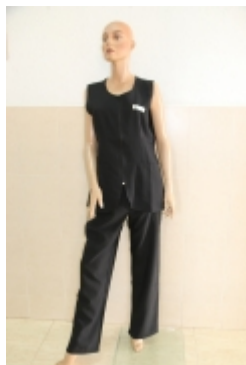
Ciclo de estética.